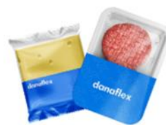
Сыр, мясные продукты