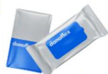
Влажные салфетки, твердое мыло