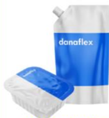
Соусы, майонез, кетчуп