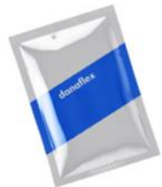
Специи и приправы