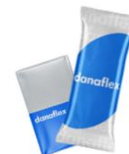
Мороженое, сл масло