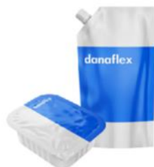
Соусы, майонез, кетчуп