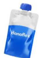
Пюре и дойпаки