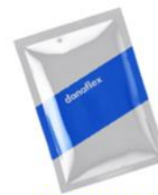
Специи и приправы