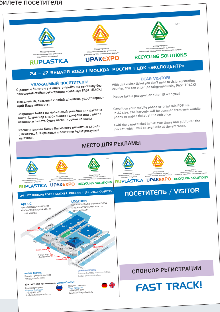
Пример электронного билета